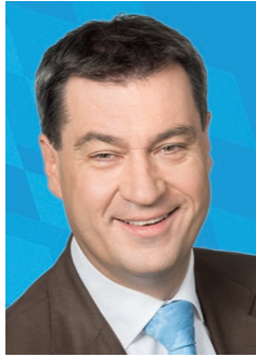
Dr. Markus Söder, MdL Staatsminister